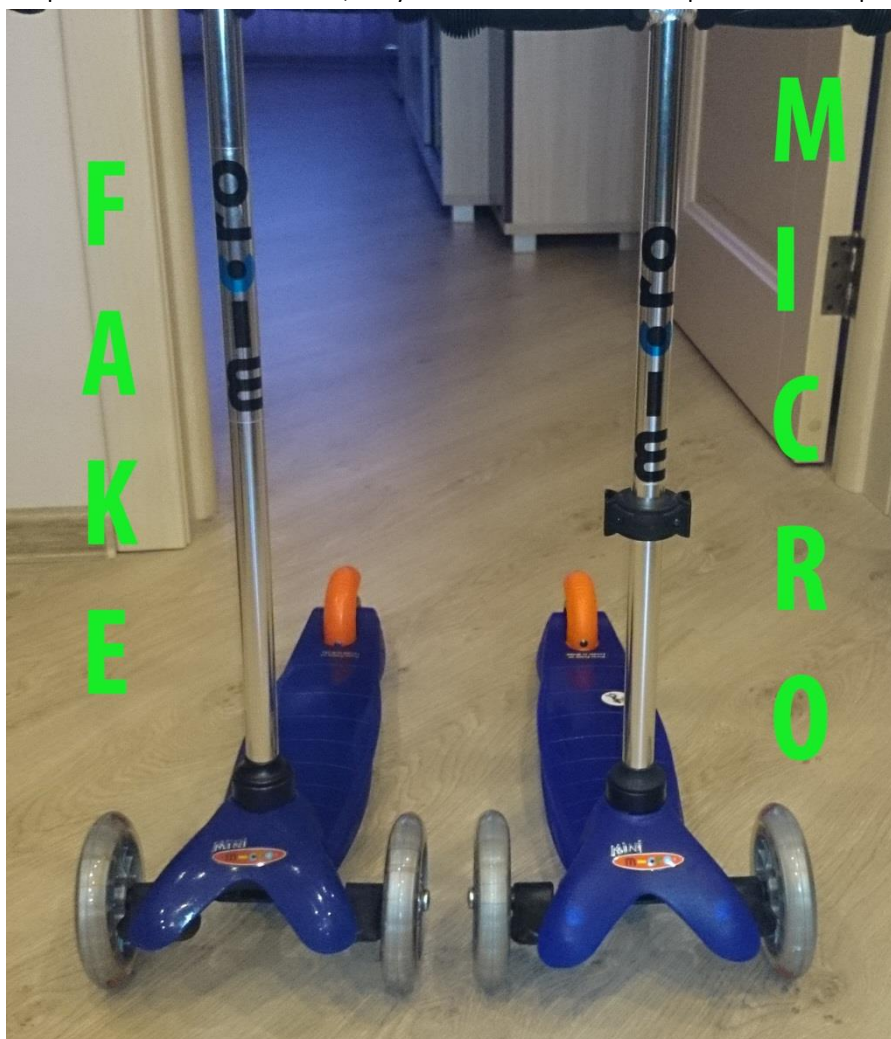
Рис.1. Слева – подделка, справа – оригинал.

Однако теперь появились копии Micro, визуально неотличимые от оригинала на первый взгляд.